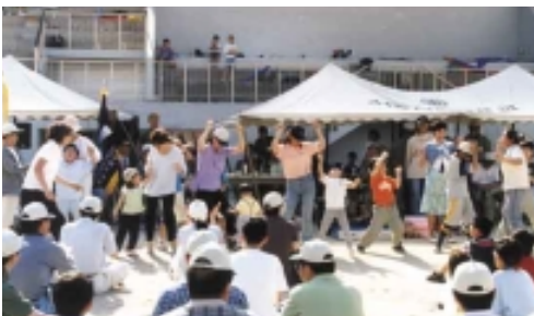
가 | 가 ! , !!, 가 !!