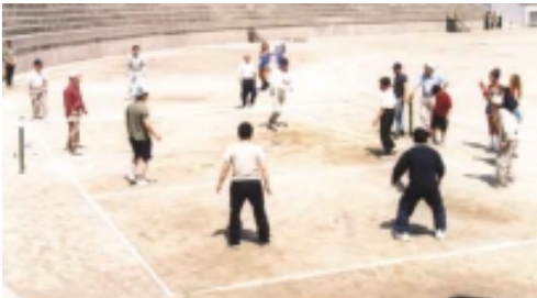
( '85) 가