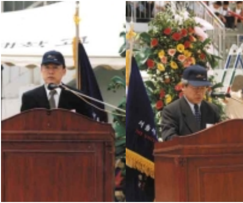
市大人 | “ 가 | ( '60) 가 .”