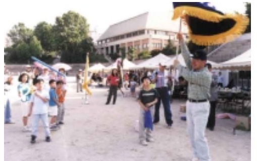
( ) ( '83)