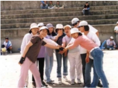
! , Fighting!